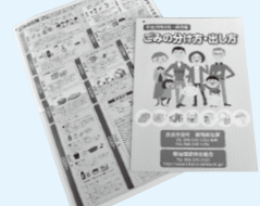
▲分別表、分け方、出し方の冊子は、市役所、各支所で配布