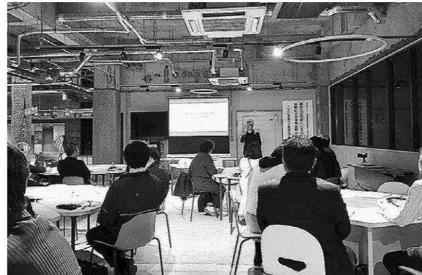
ルーロ合志フリーラウンジ内でのセミナー

2月6日と13日、ルーロ合志で地域課題解決型創業支援セミナーを、九州経済産業局との共催により開催しました。延べ51人の参加者がコワーキングスペースの有効活用方法を学びました。その後、お互いの強みを活かした協業の手法をワークショップ形式で体験。参加者からは「個人で仕事をするのは限界があるので協業の大切さを再認識しました」といった意見がありました。