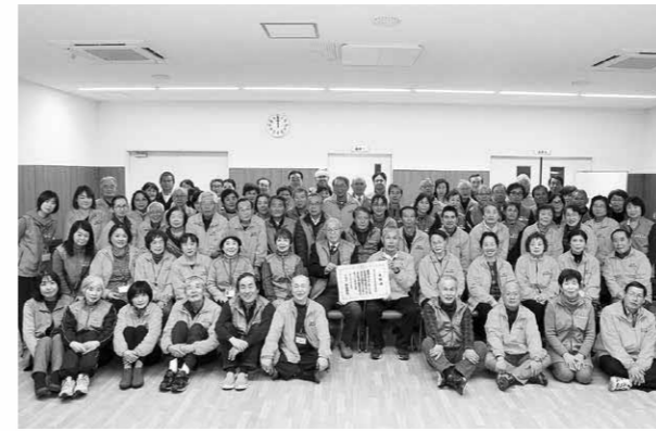
市民生委員児童委員協議会連合会の皆さん

12月20日、市民生委員児童委員協議会連合会が民生委員優良活動団体に対する厚生労働大臣表彰を受賞し、県庁で伝達式が行なわれました。同会は地域の要援護者や児童への見守り活動、高齢者・子育て支援活動など多様な活動を続けています。今回は、民生委員活動の実践を通して地域社会づくりに貢献し、その功績が特に顕著であると称えられての受賞となりました。