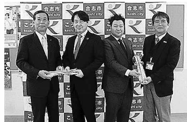
タスキを手渡す大住支部長（中央左）と早田副支部長（中央右）

このタスキは毎年、交通安全の願いを込め市内中学校の新入学生に贈られ、登下校時に活用されています。