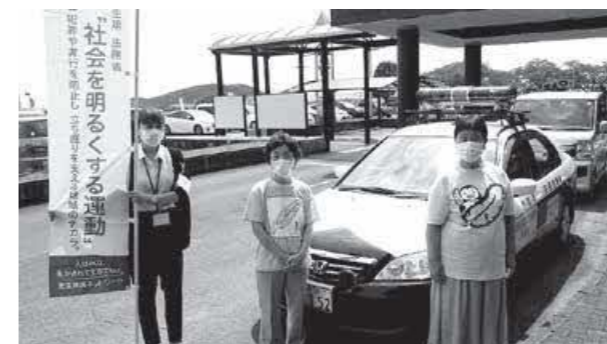
菊池地区保護司会合志分会の皆さん(中央と右)

社会を明るくする運動は、犯罪や非行の防止と、あやまちを犯した人たちの立ち直りを支えることができるよう、理解を深める運動です。またそれぞれの立場から地域で力を合わせ、犯罪や非行のない明るい地域社会を築くことを目指しています。