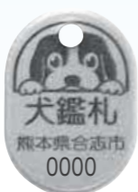
鑑札は必ず犬に着ける