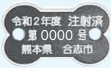
注射済票は必ず犬に着ける