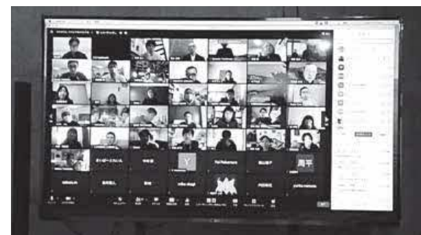
塾生はオンライン上で学びました

料理の素材を育てることに興味を持ち、転入をきっかけに農業に携わっています。育てた作物を喜んでもらえることに充実感や感動を覚え、より多くの人に農業のかわこよさや素晴らしさを映像化して伝えたいと思った時に本塾と出会いました。チームで取り組んだことで自身の強みに気づき、今後の活動に生かす準備ができ、頼れる仲間ができました。