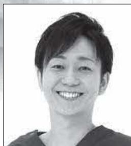
合志アンビー歯科 矯正歯科 院長