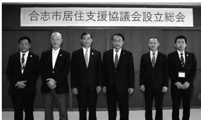
さまざまな団体が連携し、課題解決に取り組めます