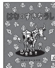
『はなのすきなうし』