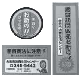
訪問販売お断りステッカー

※ステッカーを作成しています。必要な人は消費生活センターへお問い合わせください。