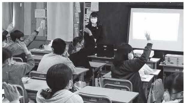
南ヶ丘小学校での租税教室の様子

児童たちはアニメで税金のある世界とない世界を学び、レプリカの1億円の重さを体験するなど、さまざまな学習をしました。児童たちから積極的に発言があり、税金が生活に深くかかっていることに理解を深めました。