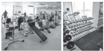
トレーニングルームの様子

ご利用案内 運動できる服装と室内用シューズ着用を推奨します。シャワー完備の更衣室あり。初回ご利用の際には、スタッフまでお気軽にお声がけください。