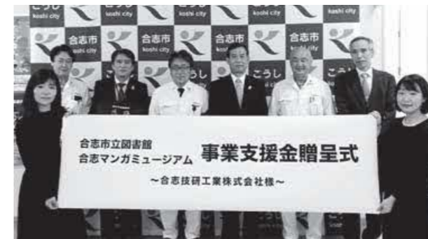
各館の充実のため、有効に活用します

今後、さらに市民の皆さんに楽しんでいただけるように、市立図書館と合志マンガミュージアムの事業充実に活用されます。