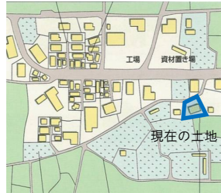
図2 換地後のイメージ