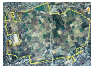
光の森周辺の 昔と今