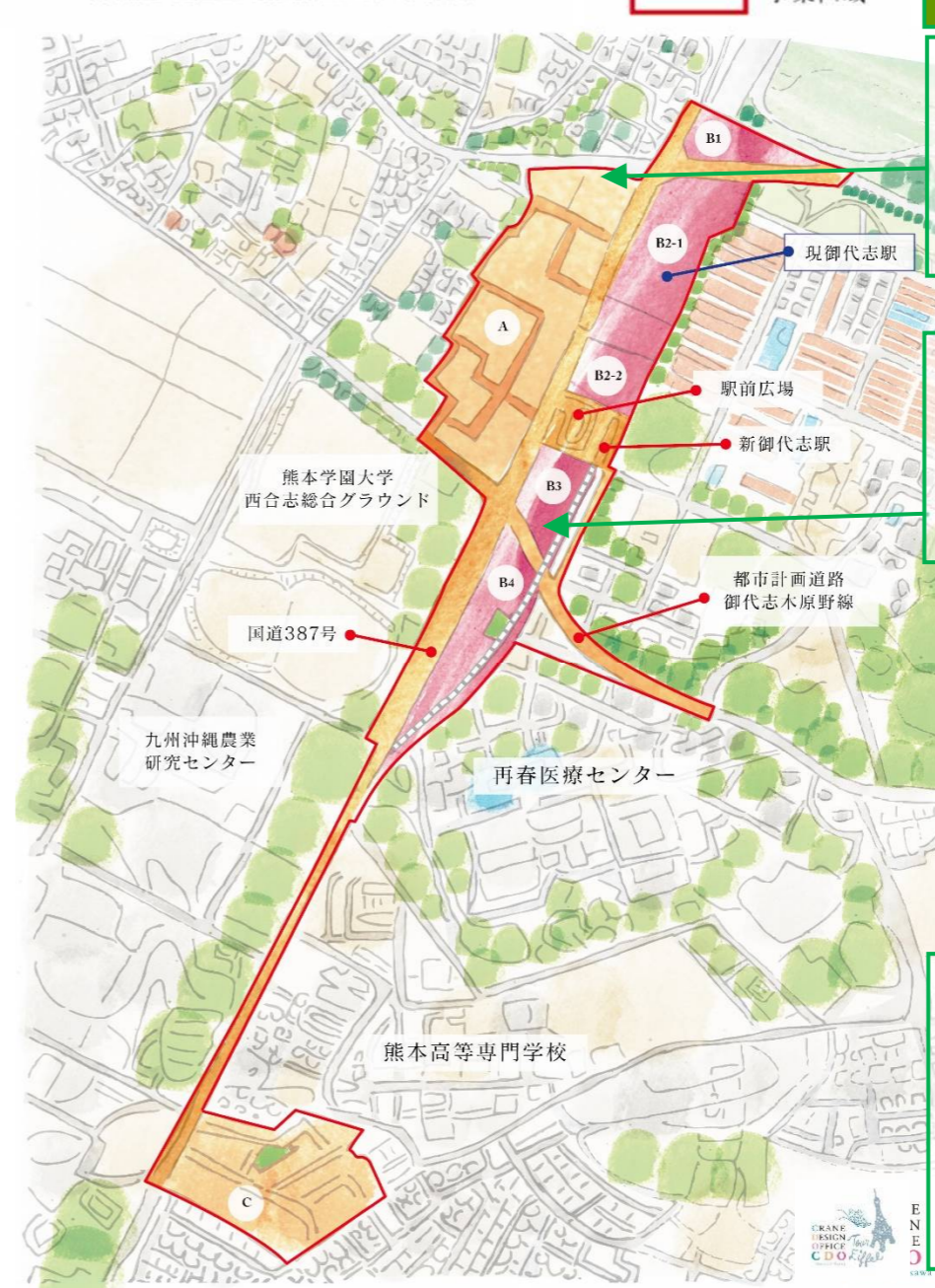
御代志地区土地区画整理事業概要

土地区画整理事業では、現在都市計画道路の工事着手のための準備や、仮換地案の作成などを行なっています。仮換地案については今年中に各地権者への説明を行う予定で進めておりますので、よろしくお願いいたします。