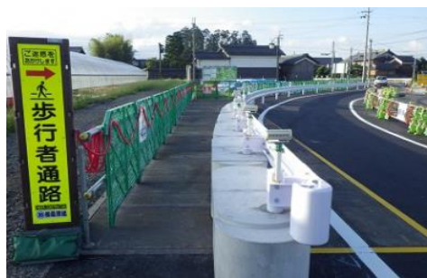
参考：仮歩道のイメージ