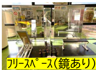
フリースペース(鏡あり)