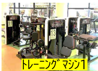
トレーニングマシン1