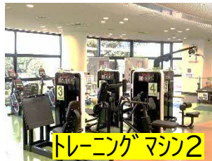
トレーニングマシン2