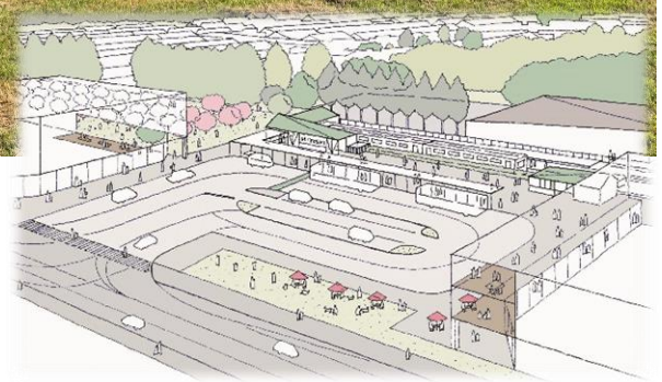
駅前広場完成イメージ

新御代志駅開業について 関係機関と調整の結果、R4年の秋頃の見込みとなりました。