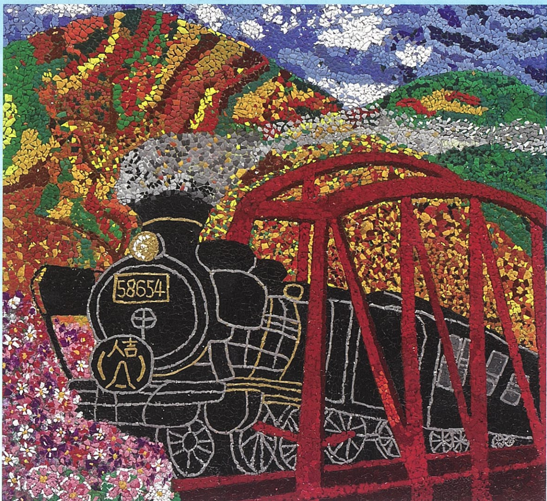
人吉SL号 菊池病院デイケア創作グループ