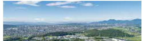
安心して暮らせるまちづくり

人口増加や企業集積に伴い交通渋滞が深刻化しており、道路インフラの整備を国・県とも協力しながら、迅速に進めていく必要があります。また、自然災害発生に備え、防災・減災対策を充実させること、交通事故・犯罪を減らしていくことにより、市民が安心して生活できる環境を整える必要があります。