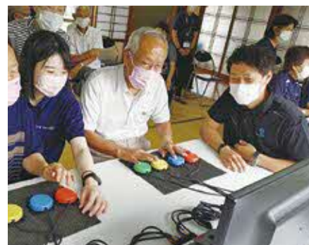
誰でも楽しめる「UDe-スポーツ」