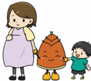
子育てしやすいまちを目指して!

本市の人口増加は、主に子育てを行う現役世代に支えられており、多くの子育て世帯が暮らしています。安心して子育てが行えるよう支援制度・子育てに関する相談体制を充実させる等の取組みを進めるとともに、義務教育をはじめとした教育環境を充実させること、本市で育つ子どもたちが地元の歴史や文化等に触れることにより地域について学ぶことで、郷土愛を持てるようにすることも重要です。