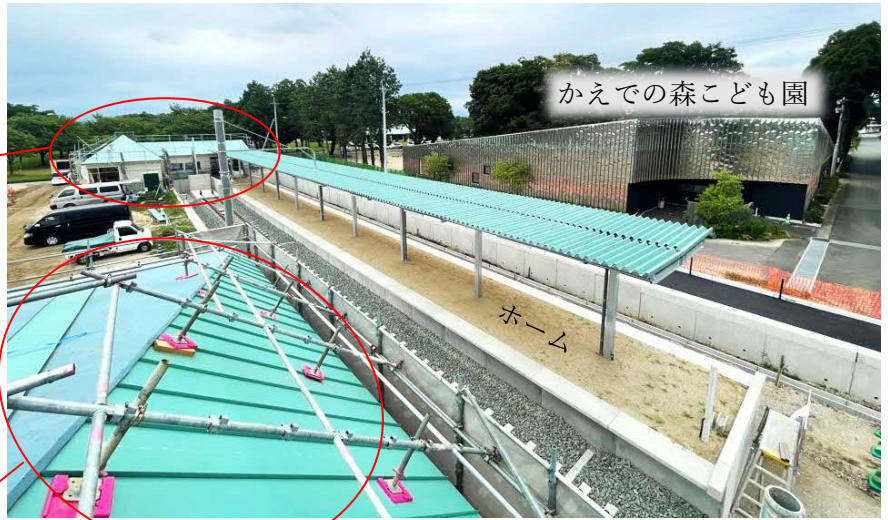
かえでの森こども園