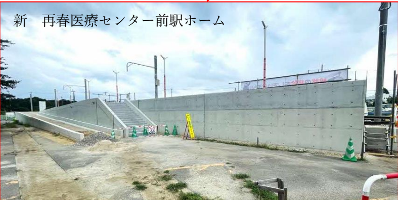
新 再春医療センター前駅ホーム

御代志木原野線の恵楓園側（車道）を舗装しました。病院側（車道）と歩道の舗装はR4年8月中旬頃を予定しています。