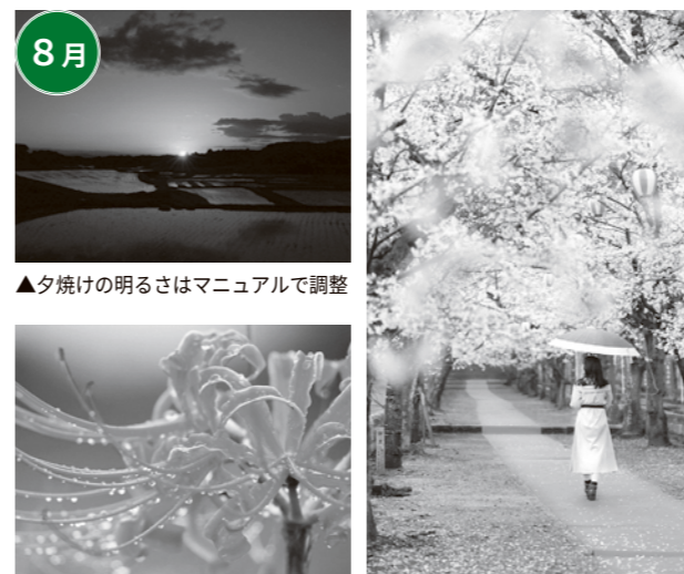
▲夕焼けの明るさはマニュアルで調整

今回の基礎編をもとに、実際に参加者自身で撮影をしようとして、さらに「こんな写真が撮りたい」という声がありました。そういった新たな試みや疑問などにも対応しながら、市民の皆さんがカメラ趣味を楽しむお手伝いをしていきたいと考えています。今後も実施を予定していますので、興味のある人はホームページから予約してください。