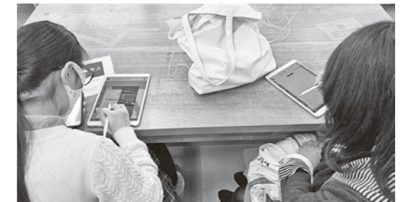
▲タブレットを使ったワークショップの様子