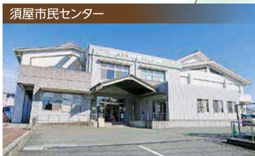
須屋市民センター