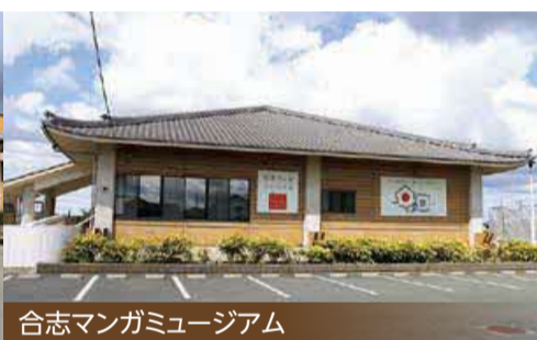
合志マンガミュージアム