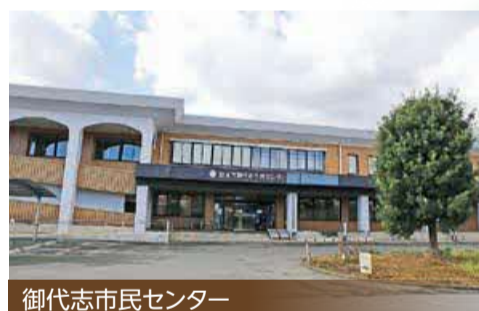
御代志市民センター