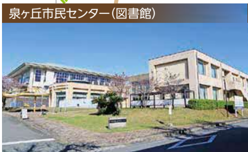
泉ヶ丘市民センター(図書館)