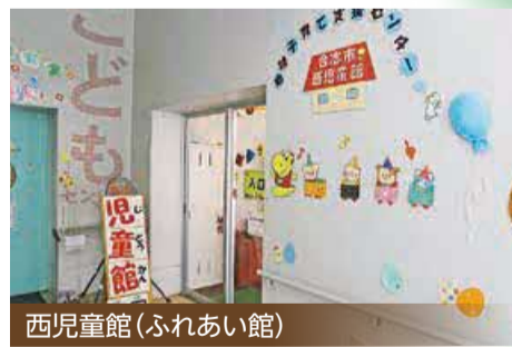
西児童館(ふれあい館)