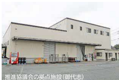
推進協議会の拠点施設(御代志)

平成29年度に設立した、「くまもと未来型農産業コンソーシアム推進協議会」。合志市の農業の振興、発展のため多面的な事業を進めています。ほうれん草の周年栽培では、供給が不足する夏場に販売を行なうことで他産地との優位性を図ることが可能になりました。また、令和2年度から、市の竹林の整備・保全と合わせ、タケノコを原料供給する取り組みを始めた他、農業の産業化を目指したビジネススクール、若手農業者の人材育成と所得向上を目的としたドローン事業も行なっています。今後も、地域活性化や新技術・産業の創出、集積を目指します。