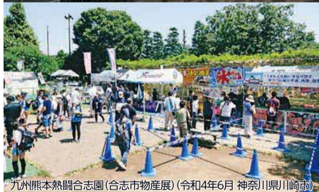
九州熊本熱闘合志園(合志市物産展)(令和4年6月 神奈川県川崎市)