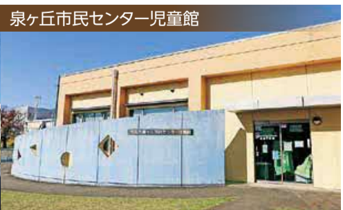
泉ヶ丘市民センター児童館