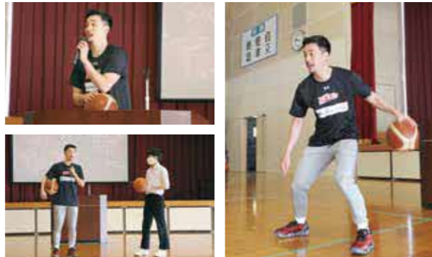
1・2年生(当時)を対象に講演しました

3月7日、西合志中学校でキャリア教育講演会が開かれ、熊本ヴォルターズの田渡選手が講演しました。田渡選手は、令和4年7月にヴォルターズに加入し、日本バスケットボール選手会の会長も務めています。「どんなに失敗しても続けること、目標に挑戦することが大事だと思います」と生徒たちに語りかけた田渡選手。ドリブル対決では華麗な技も披露しました。