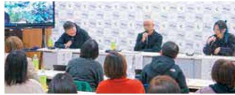
公開審査会の様子