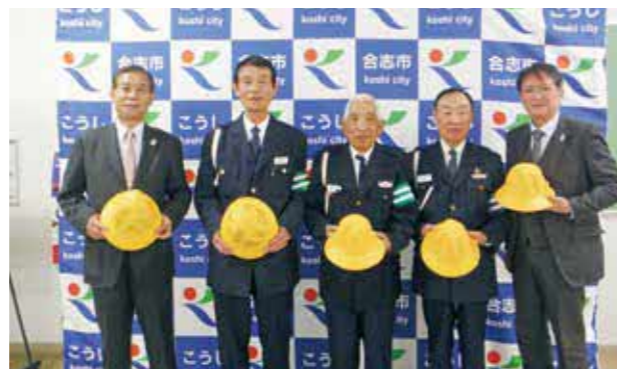
熊本北合志地区交通安全協会合志支部の皆さん

この黄色い帽子は毎年、交通安全の願いを込めて市内小学校の新1年生に贈られ、登下校時に活用しています。黄色い帽子を見かけたら、安全運転をお願いします。