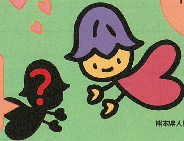
熊本県人権啓発キャラクター 「ココロ」