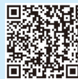
『うえるこ』機能一覧