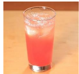
すいかとオレンジの コールドプレスジュース