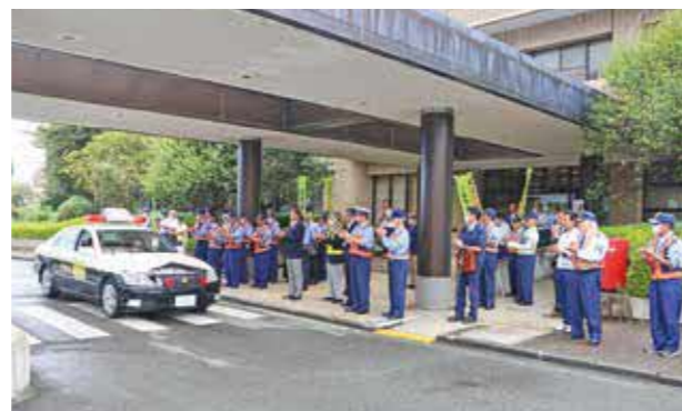
パトロールへ出発するパトカー

9月21日、市役所で『秋の全国交通安全運動』（9月21～30日）の出発式を行ない熊本北合志警察署、交通安全協会・熊本市北区・市内各地区の交通指導員など約50人が参加しました。また、パトカーと市の交通指導車が北合志警察署交通第一課長の号令とともにパトロールへと出発し、市民の交通安全意識の高揚と交通事故防止の徹底を呼びかけました。