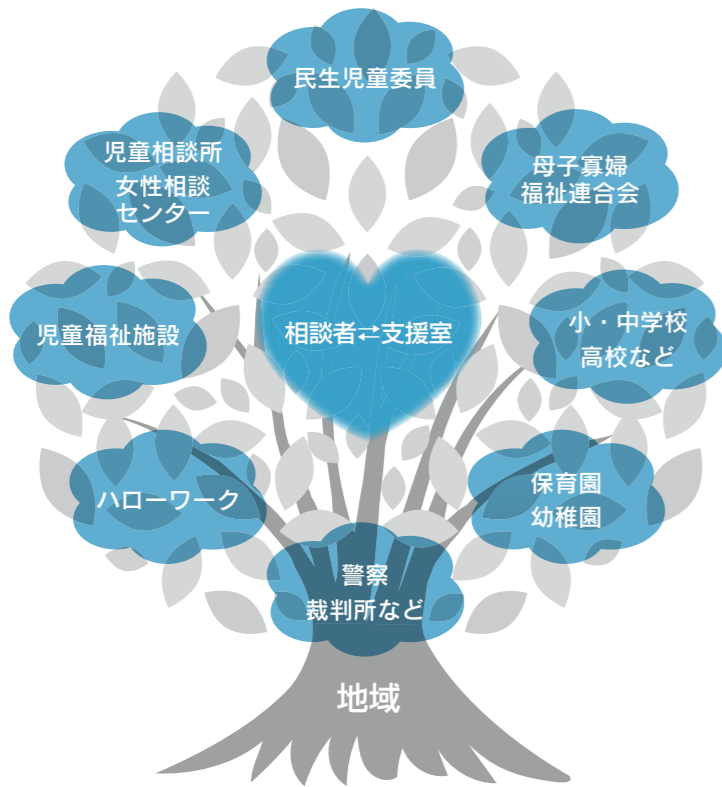
相談者を支える地域の輪

勇気を出して一歩踏み出し、私たちにお話を聞かせてください。一緒に考え、より良い解決方法を探していきます。