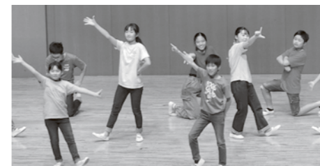
躍動感あふれるダンスを披露する劇団員たち

11月11日、熊本テルサで第54回九州地区子ども会育成研究協議会が開催され、オープニングアクトにヴィーブル子ども劇団が出演し、ダンスを披露しました。また、昨年3月に行なった公演のダイジェスト版DVDも上映しました。同協議会には、九州全県から子ども会の育成に関わる関係者らが参加し、子どもたちのパワーあふれるダンスと劇に見入っていました。終演後には「このような劇やダンスを初めて観た」「子どもたちの生き生きとした、そして堂々とした姿に感動した」などの感想がありました。ことしも3月に公演を予定していますので、楽しみにしてください。