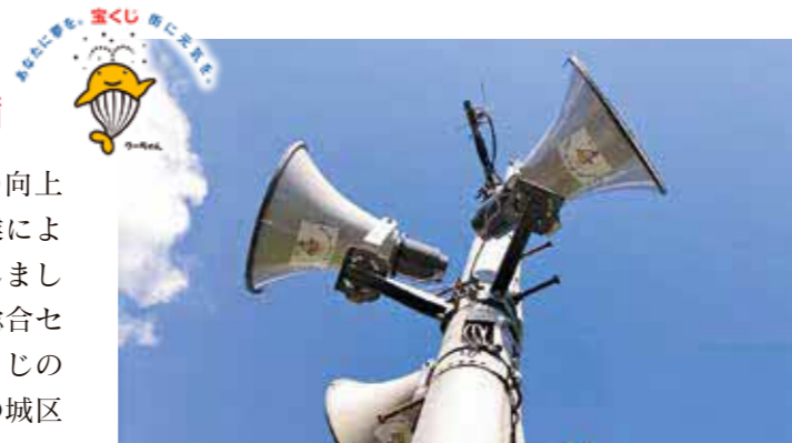
城区に整備された無線放送システム

11月中旬、地域社会の健全な発展と住民福祉の向上に寄与することを目的としたコミュニティ助成事業により、城区がコミュニティ無線放送システムを整備しました。この、コミュニティ助成事業は、(一財)自治総合センターが、宝くじの社会貢献広報事業として、宝くじの受託事業収入を財源に実施しているもので、今後の城区のますますの活性化が期待されます。