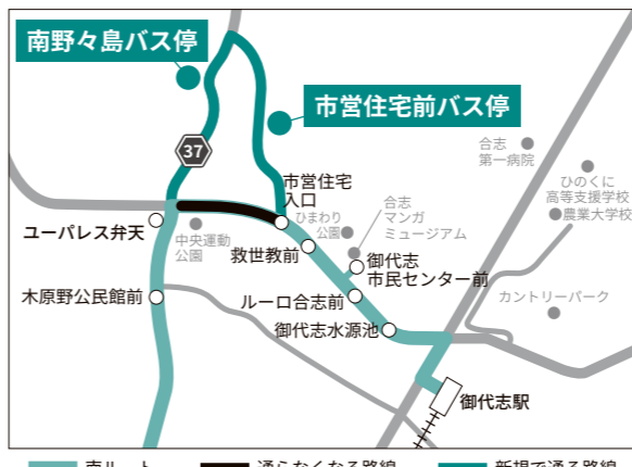
南ルート元の路線 通らなくなる路線 新規で通る路線