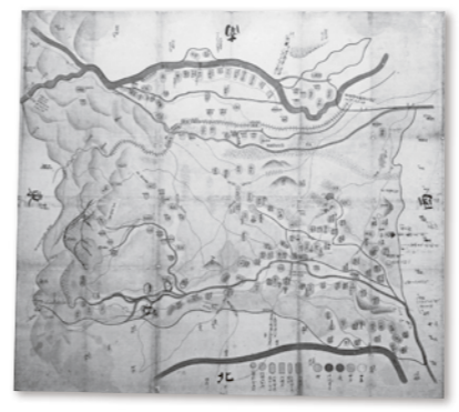
▲合志郡絵図(市歴史資料館所蔵)

合志の地名については『日本書紀』という歴史書の持統天皇10(696)年の項に「肥後国皮石郡の壬生諸石」という人の記述があります。また、和銅6(713)年、