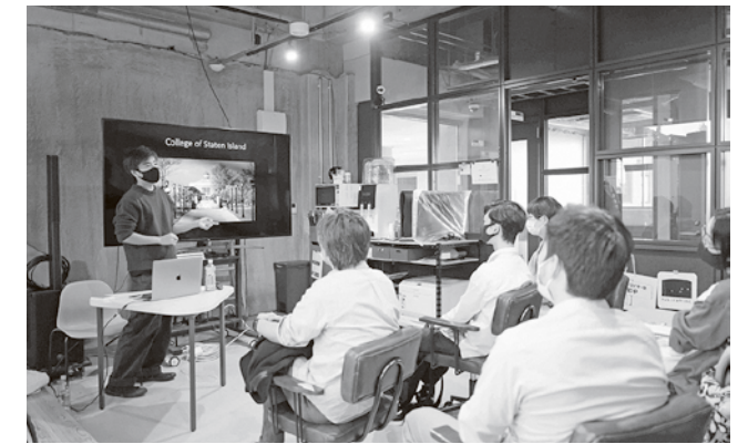
▲映像作家による映画理論セミナー(講習一部)

これらの活動を通じて、本市がますます活気に満ちた魅力的なまちとなるよう、引き続き全力で取り組んでいきます。