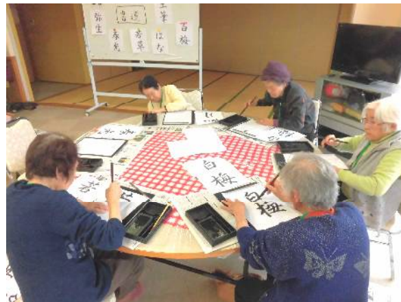
アクティビティの様子