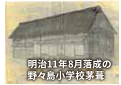
明治11年8月落成の 野々島小学校茅葺