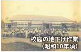
校庭の地下げ作業 (昭和10年頃)