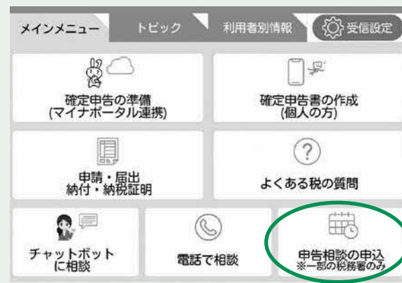
▲国税庁LINE公式アカウント