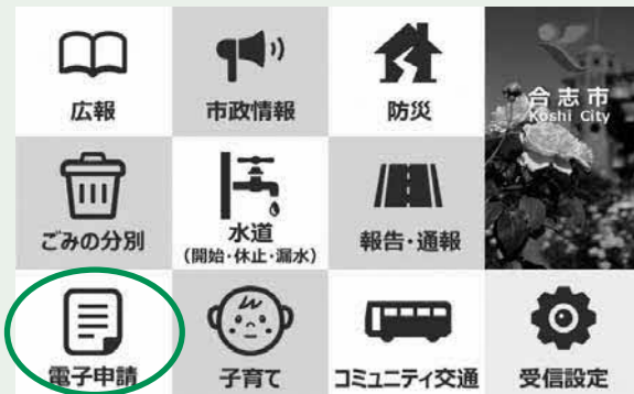
▲市LINE公式アカウント

スマートフォンによる入場申し込みや予約の方法がわからない場合は、14ページに掲載している『スマホお助け相談窓口』を活用してください。