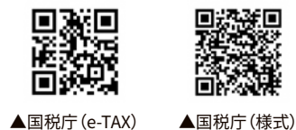
▲国税庁(e-TAX) ▲国税庁(様式)

また、申告関係の様式は税務課窓口か、国税庁のホームページからダウンロードできます。