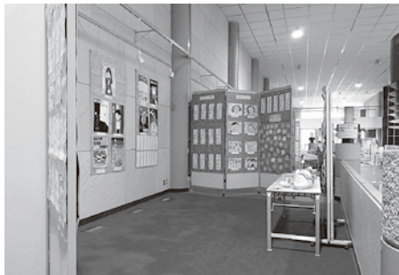
「ヴィーブル」展示ギャラリーでの展示も行ないました(令和7年12月)