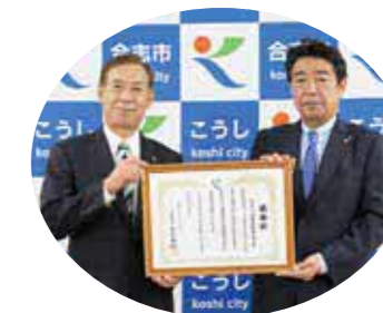
ネットトヨタ熊本株式会社 (本社 熊本市東区)