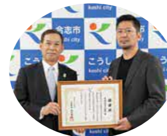
株式会社タウン開発 (本社 熊本市中央区)