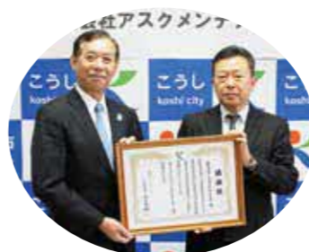
株式会社アスクメンテナンス (本社 熊本市南区)

令和7年度は、27社から計約3,180万円の寄附がありました。本市のまちづくりの取り組みに賛同して下さった企業を紹介します。