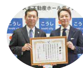
株式会社コスギ不動産ホールディングス (本社 熊本市中央区)