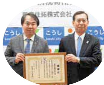
新産住拓株式会社 (本社 熊本市南区)