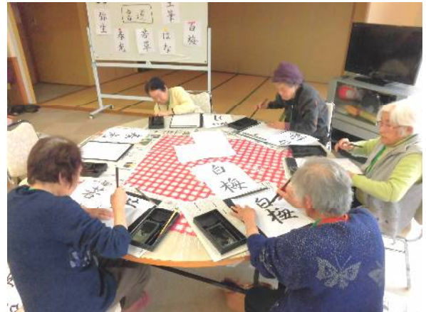
アクティビティの様子