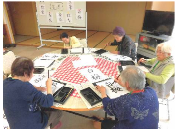
アクティビティの様子