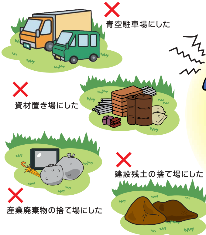
× 青空駐車場にした