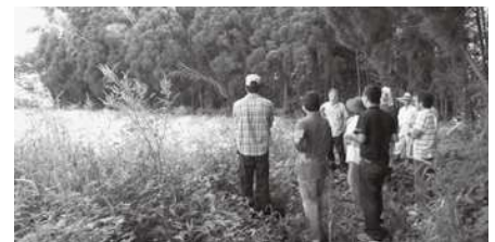
農地パトロールを実施する委員たち

合志市管内の荒れている農地を把握するためにパトロールを実施しました。この活動は毎年行なっており、新たに発見された遊休農地もありましたが、解消された農地もいくつかありました。今後も遊休農地の発生防止、解消に努めていきます。