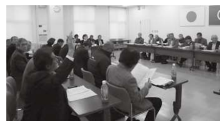
農業委員先進地研修会の様子

出席した委員の意見の中で最も多かったのは筑紫野市の農地パトロールの取り組み方についてでした。筑紫野市では今年度から航空写真をタブレットに取り込み、それをもとにパトロールすることで精度、実績の向上につながられました。合志市でもこの方法を取り入れる方向で考えており、遊休農地の発生防止・解消につながればと思います。